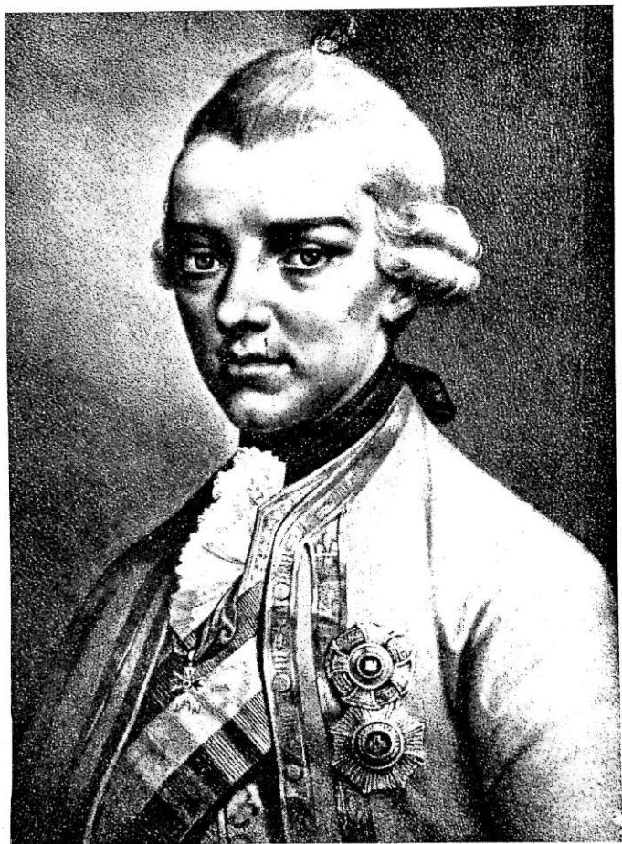
Una stampa insolita di Pietro Leopoldo ( Coll. Baldasseroni )