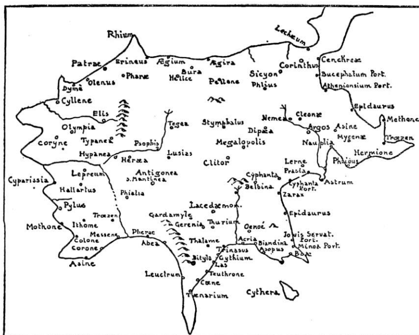
Il Peloponneso, secondo TOLOMEO

Gli scrittori dell'antichità, Greci e Romani (3), parlano ripetutamente della produzione di vini dolci o semi-dolci, cotti o non cotti (apyri). Questi tipi di vino erano prodotti in molte località della Grecia e dell'Italia. Esiodo (8° sec. a.C.) accenna alla produzione di vino dolce (4) in seguito dell'appassimento delle uve al sole (versi 607-612), e più tardi (5° sec. a.C.) pure Democrito (5). Dioscoride (nel 1° sec. d.C.) cita il vino preparato da uve appassite, per un certo tempo, al sole, tecnica che era considerata necessaria per la produzione del vino chiamato criticos (cretese = dell'isola di Creta) o pramnios (6). Pure Marziale (nello stesso secolo, 42-103 d.C.) si riferisce al vino di Creta chiamato passum e prodotto nei dintorni di Cnosso (7).