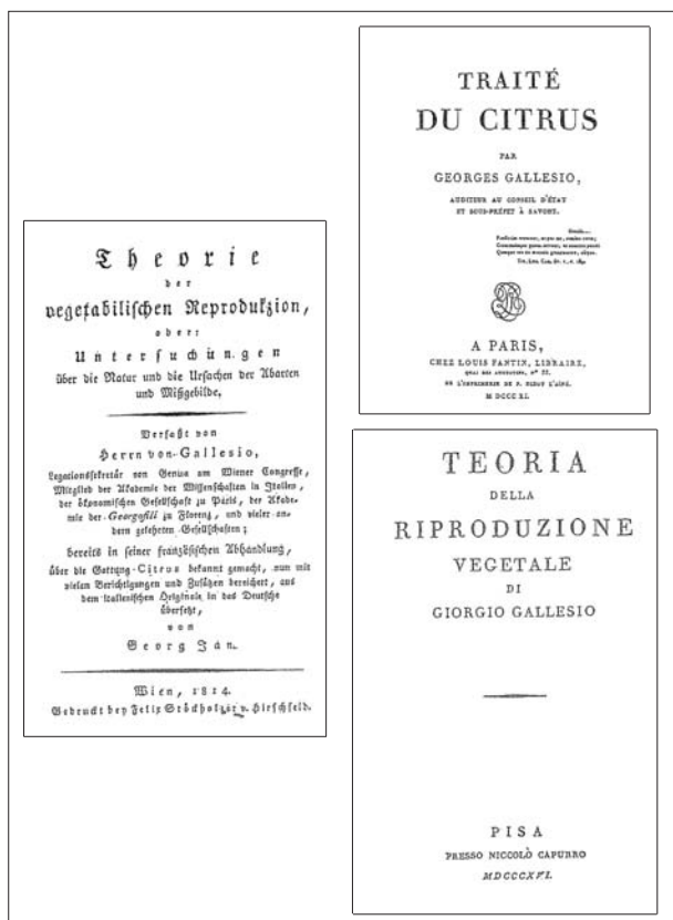
Fig. 2 I frontespizi del Traité du Citrus e delle due edizioni (tedesca e italiana) della Teoria della Riproduzione vegetale di Giorgio Gallezio

lesio 10 che, noto soprattutto per i suoi importanti contributi citrografici e pomologici 11 , si era però attivamente occupato anche della riproduzione delle piante sviluppando, nella sua Villa dell'Aquila presso Finale, numerose ricerche sperimentali 12 .