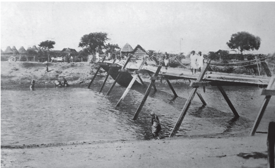
Ponte provvisorio dell'Uebi Scebeli (da G. De Martino, La Somalia nostra, cit., p. 68).