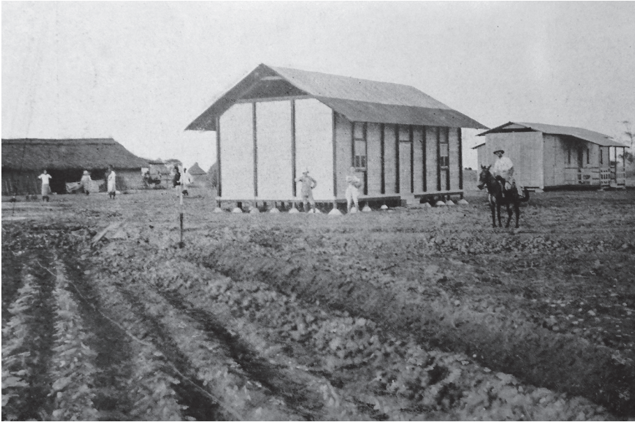
Azienda sperimentale di Genale, le prime casette (da G. De Martino, La Somalia nostra, cit., p. 60).