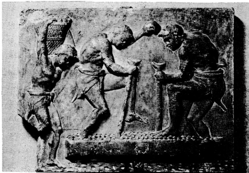
FIG. 3. — Pubblicato da C. Anti, Il Regio Museo Archeologico nel Palazzo Reale di Venezia , p. 150, n. 2. Proviene dal lascito del procuratore Federico Contarini del 1592 alla Repubblica di Venezia. Marmo greco. Attribuito agli inizi del II sec. d.C. (Per gentile concessione della Soprintendenza alle Antichità delle Venezie).