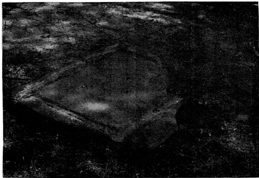
FIG. 2. — Base di torchio romano, in arenarie. Burlazzo; scasso del vigneto del Tesoro cm 112 \times 115 , spessore 10-14, canaletta (larga cm 6-7, profonda cm 3,5).